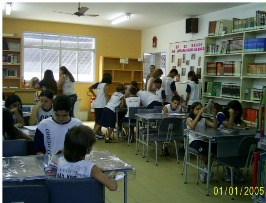
Alunos na biblioteca do CSJ

O Brasil é um dos países que menos investe na educação e menos incentiva a leitura, países muito mais pobres que o Brasil, como o Quênia, tem uma porcentagem de leitura maior que o nosso país.